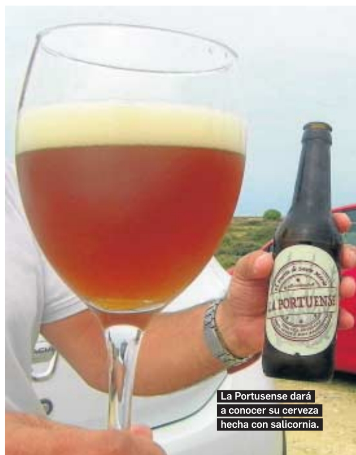
La Portuense dará a conocer su cerveza hecha con salicornia.

El maridaje con los vinos de la zona será el otro puntal de la gran celebración