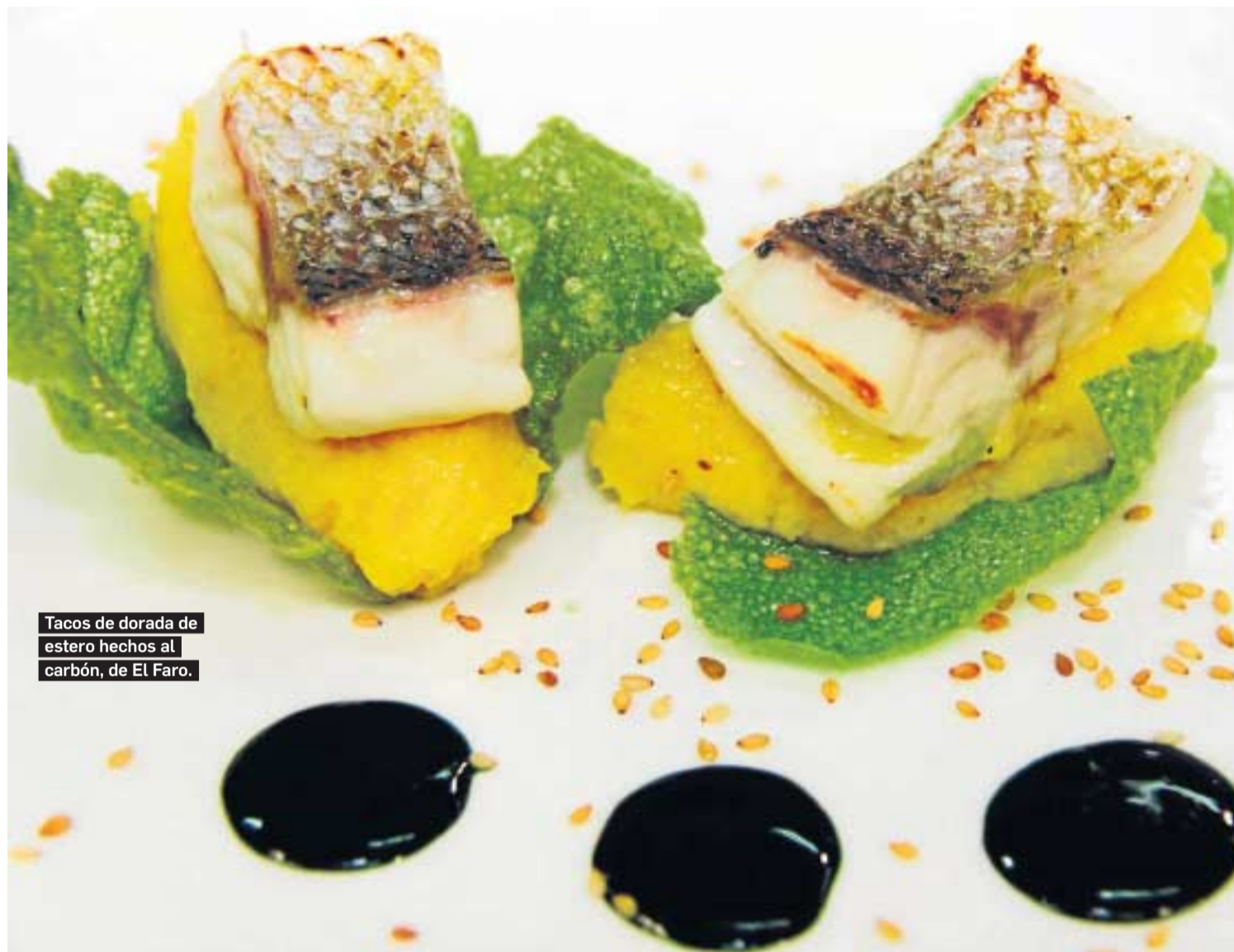
Tacos de dorada de estero hechos al carbón, de El Faro.

En el evento también colabora y expondrá sus productos la firma Unic, dedicada al asesoramiento al sector hostelero.