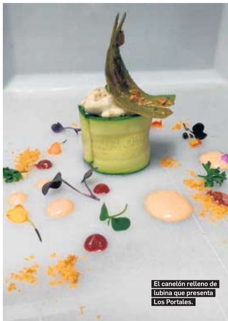
El canelón relleno de lubina que presenta Los Portales.